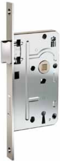
EINSTECKSCHLOSS, KL. 1