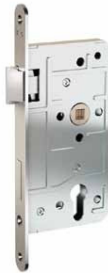
EINSTECKSCHLOSS, KL. 3