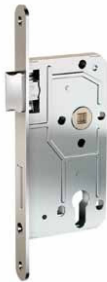
EINSTECKSCHLOSS, KL. 2